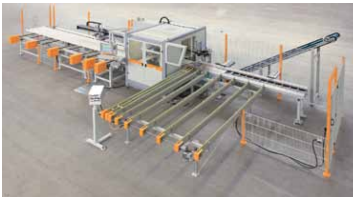
Das SCHIRMER Bearbeitungszentrum BAZ 1000-SVU bietet höchste Präzision und Schnelligkeit.

automatisch, der Stahleinschub manuell oder ebenfalls vollautomatisch. Stahl kann sowohl verschweißt als auch ausgestanzt werden. Für die Stahlverschraubung und die Bearbeitung an stahlarmierten Profilen setzt SCHIRMER eine neue Motor-Technologie ein, die Höchstleistungen auf kleinstem Raum verspricht. Sogar für die Dichtungshinterfräsung bietet der Hersteller verschiedene Varianten an. Die vollautomatische Applikation von Schließteilen aller Art, das automatische Fräsen der „Wetterschenkelnut“ sowie das automatische Ab stapeln und Sortieren der Profile runden die hohe Bearbeitungsvielfalt der modularplus-Baureihe von SCHIRMER ab.